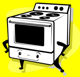
R2 GRANDI BIANCHI