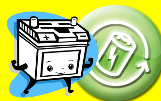
BATTERIE E PILE

Si avvisano i cittadini che la raccolta dei rifiuti RAEE sarà attuata (previa prenotazione obbligatoria da effettuare presso il Comune di Campofiorito - Ufficio Tecnico) direttamente presso le abitazioni dei richiedenti.