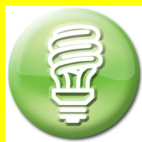
R5 SORGENTI LUMINOSE