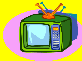
R3 TV E MONITOR