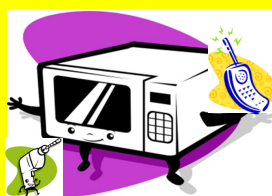
R4 PICCOLI ELETTRODOMESTICI